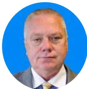
Paídí Ó Sé (Ceaptha 4 Samhain 2010)